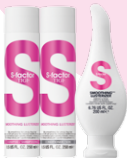
S овершенная гладкость