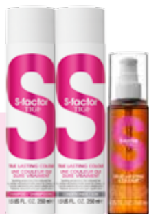
S охранение цвета