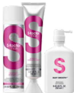
S екрет идеальных волос