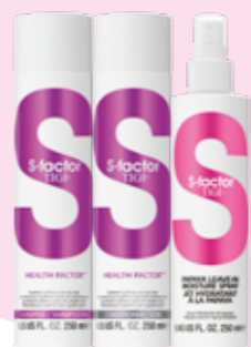
S ила здоровых волос