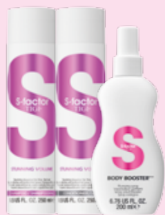
S ексуальный объем