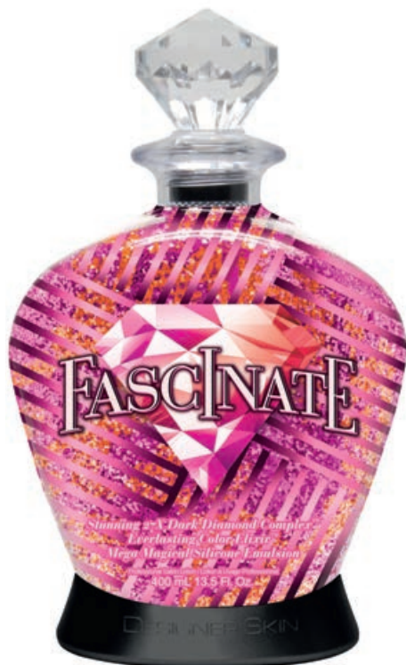
Fascinate™ • 400 мл / 15 мл Стойкий, проявляющийся загар.

27X увлажняющая эмульсия с выраженной коррекцией оттенка, подчеркивающая бриллиантовое сияние кожи.