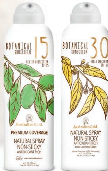
Botanical SPF 15/30 Natural Spray • 177 мл

Гипоаллергенные защитные спреи с минеральными фильтрами.