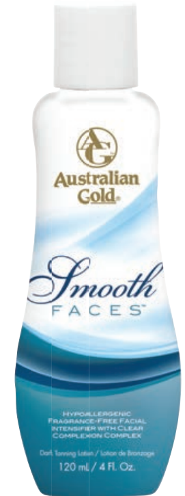
Smooth Faces® • 118 мл / 15 мл Ускоритель загара.

Гипоаллергенный активатор для загара лица.