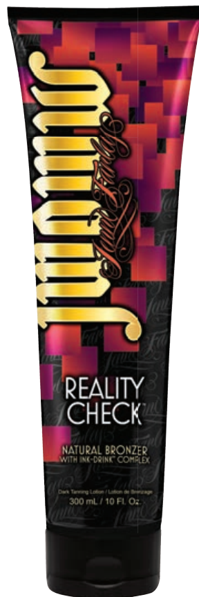
JWOWW Reality Check™ • 300 мл / 15 мл