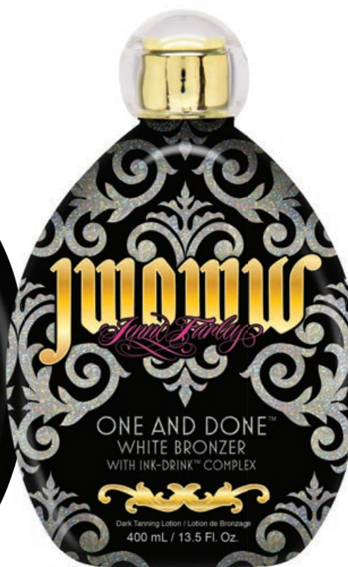
JWOWW One and Done™ White Bronzer • 400 мл / 15 мл