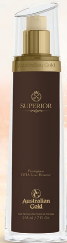
Superior™ DHA Bronzer • 205 мл / 28.5 мл Стойкий, проявляющийся загар.

Высокотехнологичная сыворотка с бронзирующим комплексом класса «Люкс».