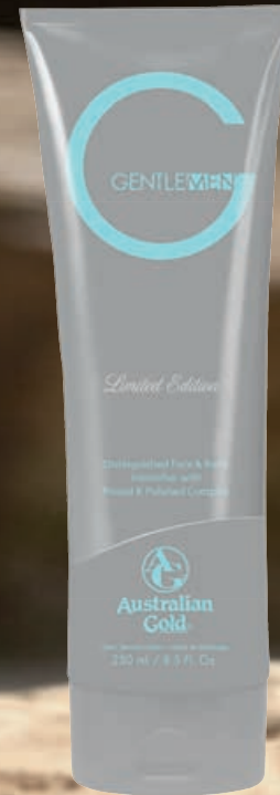
G Gentlemen® Dark Intensifier Limited Edition • 250мл / 15 мл Ускоритель загара.

Мужской лосьон для загара, активирующий выработку собственного меланина, с особым ухаживающим комплексом.