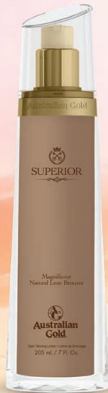
Superior™ Natural Bronzer • 205 мл / 28.5 мл Коррекция оттенка загара.

Высокотехнологичная сыворотка-активатор с комплексом корректирующих бронзаторов класса «Люкс».