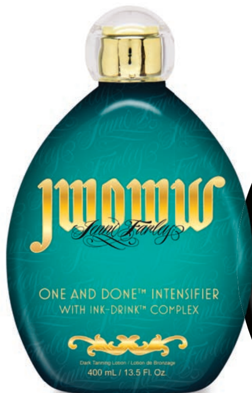
JWOWW One and Done™ Intensifier • 400 мл / 15 мл