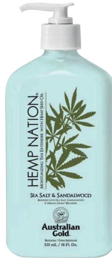
Hemp Nation® Sea Salt & Sandalwood • 535 мл

Профессиональный питательный лосьон для ежедневного применения на основе масла семян конопли с комплексом усиления оттенка загара.