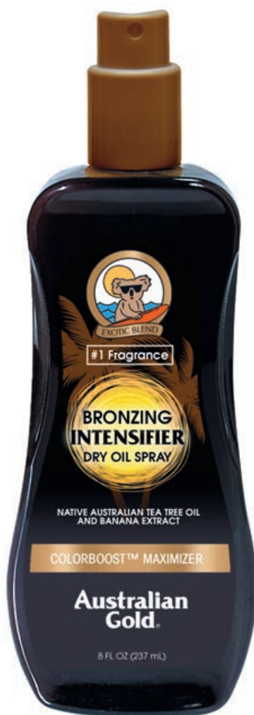
Bronzing Dry Oil Spray Intensifier • 237 мл

Улучшенная формула, усиленная экстрактом Моркови, насыщает кожу витаминами, питательными веществами и ферментами, для получения темного оттенка загара. Комплекс масел (Сафлоровое, Оливки, Какао) интенсивно увлажняет и восстанавливает кожу после пребывания на солнце, сохраняя полученный оттенок загара. Масло Чайного дерева успокаивает раздраженную кожу, Витамин E и сок Алоэ заботятся о ее мягкости и нежности.