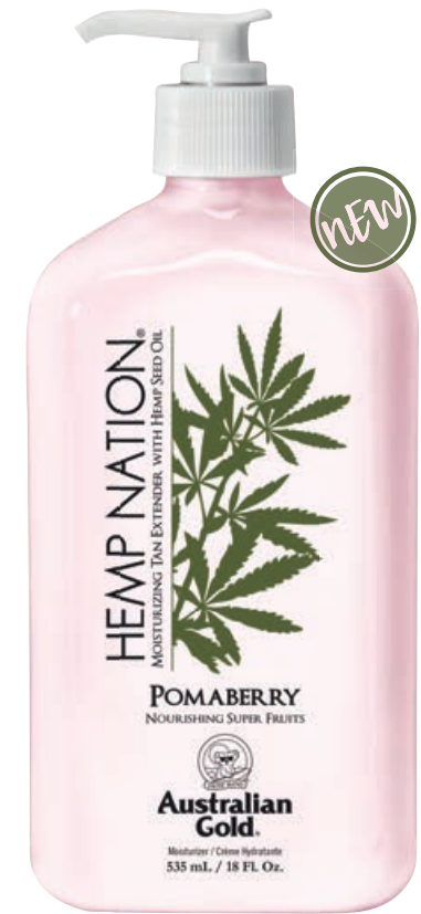
Hemp Nation Pomaberry™ • 535 мл

Профессиональный питательный лосьон для ежедневного применения на основе масла семян конопли с оздоравливающим комплексом.