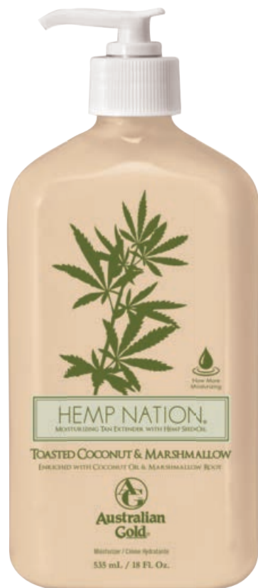
Hemp Nation® Toasted Coconut & Marshmallow • 535 мл

Профессиональный питательный лосьон для ежедневного применения на основе масла семян конопли. Содержит карамель, освежает цвет загара.