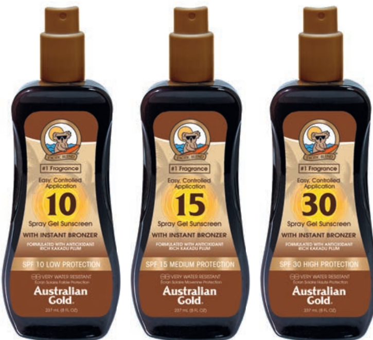
Защитные спрей-гели 10, 15, 30 с натуральными бронзаторами • 237 мл

Влагоустойчивый лосьон для лица высокой степени защиты с бронзаторами. Витамины, минералы и экстракты растений защищают от свободных радикалов, стимулируют обменные процессы, синтез коллагена, восстанавливают, тонизируют и увлажняют кожу во время загара. Входящие в состав бронзаторы сделают оттенок загара насыщеннее.