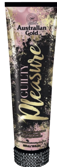
Guilty Pleasure™ • 300 мл / 15 мл Стойкий, проявляющийся загар.

Активный ускоритель загара премиум класса с технологией бесцветных, стойких и корректирующих бронзаторов.