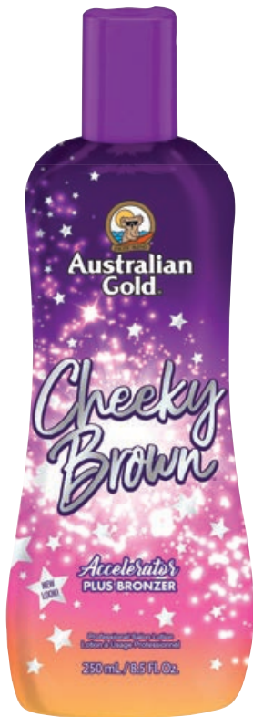
Cheeky Brown® • 250 мл / 15 мл Коррекция оттенка загара.

Крем-активатор выработки собственного меланина с натуральными корректирующими бронзаторами.