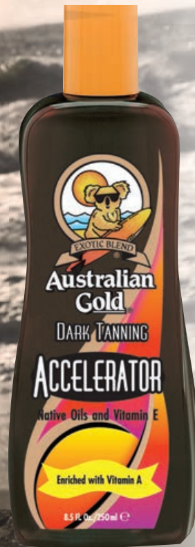
Accelerator™ • 250 мл / 15 мл Ускоритель загара.

Классический лосьон-активатор выработки собственного меланина.