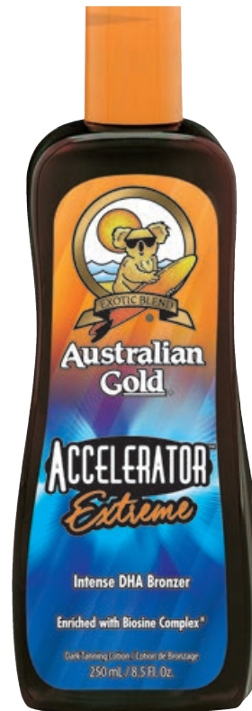
Accelerator Extreme™ • 250 мл / 15 мл Стойкий, проявляющийся загар.

Лосьон-активатор выработки собственного меланина с бронзирующим комплексом.