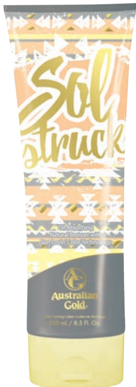
Sol Struck™ • 250 мл / 15 мл Коррекция оттенка загара.

Активный ускоритель загара с выраженным матирующим эффектом и мгновенным результатом бронзирования.