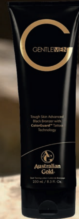
G Gentlemen® Black Bronzer • 250мл / 15 мл