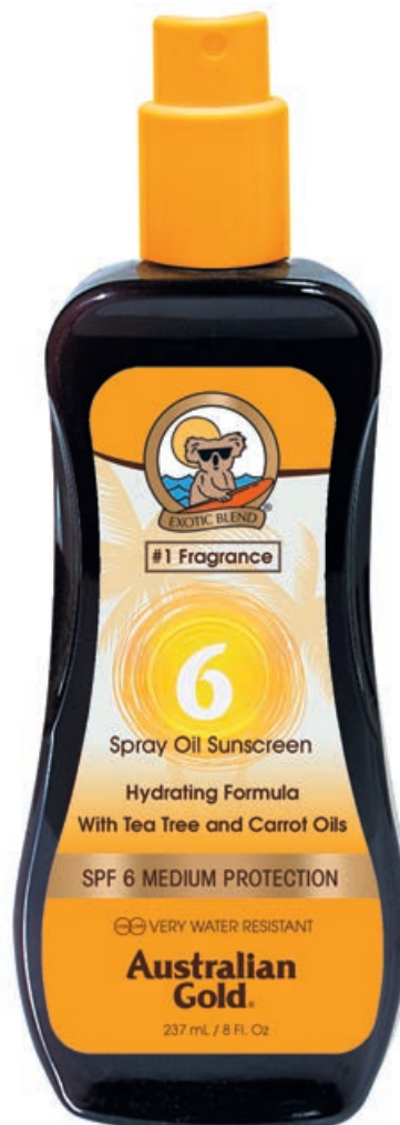
SPF 6 Spray Oil • 237 мл

Экзотические масла и натуральные бронзаторы (экстракт скорлупы Черного ореха, масло Аннато и Карамель) гарантируют темный и стойкий оттенок загара. Усиливающая формула Color Boost поможет закрепить загар и ощутимо продлить его жизнь. Экстракты семян Моркови, Банана и Алоэ Вера интенсивно увлажняют кожу и усиливают цвет загара. Витамин E и питающие кожу антиоксиданты заботятся о мягкости и нежности кожи.