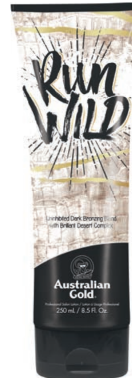
Run Wild™ • 250 мл / 15 мл Стойкий, проявляющийся загар.

Активный ускоритель загара с эффектом комплексного бронзирования.