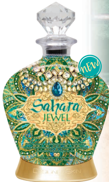
Sahara Jewel™ • 400 мл / 15 мл Коррекция оттенка загара.

30X Преображающий лосьон-активатор с уникальным бронзирующим комплексом.