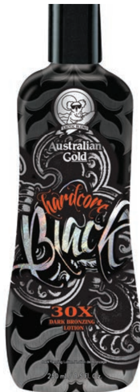
Hardcore Black® • 250 мл / 15 мл Коррекция оттенка загара.

Крем-бронзатор мгновенного действия с комплексом Derma Dark.