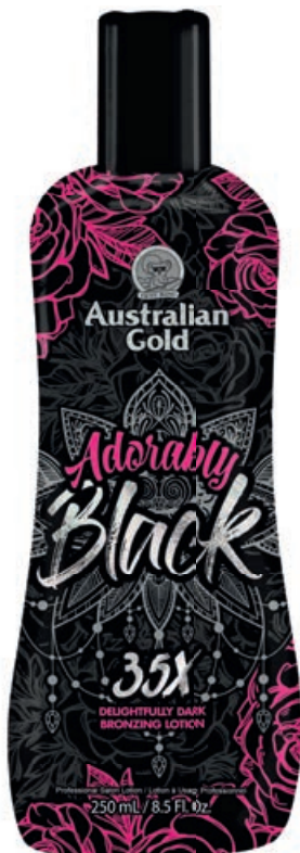
Adorably Black™ • 250 мл / 15 мл Стойкий, проявляющийся загар.

Интенсивный крем-активатор загара с бронзирующим комплексом и смягчающим эффектом.