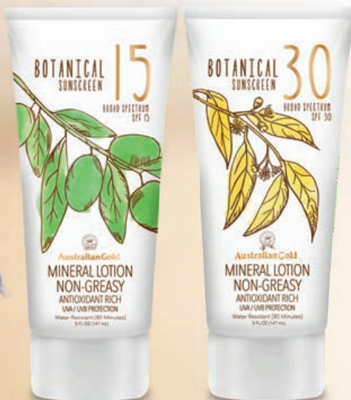
Botanical SPF 15/30 Lotion • 147 мл

Удобный формат спрея обеспечивает комфортное нанесение на кожу.