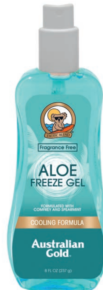
Aloe Freeze Gel • 237 мл

Масла семян Подсолнечника и Оливки, повышают способность получить глубокий оттенок загара. Морковное масло усиливает полученный оттенок и интенсивно увлажняет кожу. Слива Какаду обладает самым высоким содержанием витамина C для защиты кожи от свободных радикалов. Масло Чайного дерева успокаивает раздраженную кожу, Витамин E и сок Алоэ заботятся о ее мягкости и нежности.