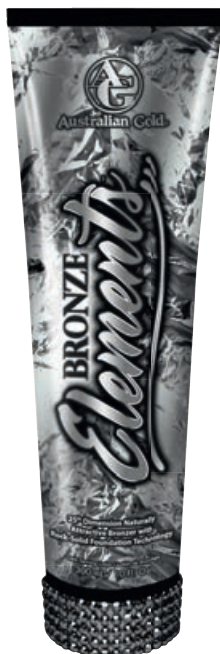
Bronze Elements™ • 300 мл / 15 мл Коррекция оттенка загара.

Активный ускоритель загара премиум класса с мгновенным эффектом бронзирования.