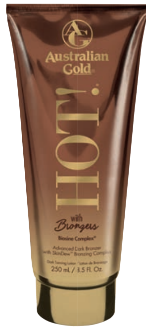
Hot!® with Bronzers • 250 мл / 15 мл Стойкий, проявляющийся загар.

Витаминный комплекс для загара, активирующий выработку собственного меланина и эксклюзивной технологией бронзирования.