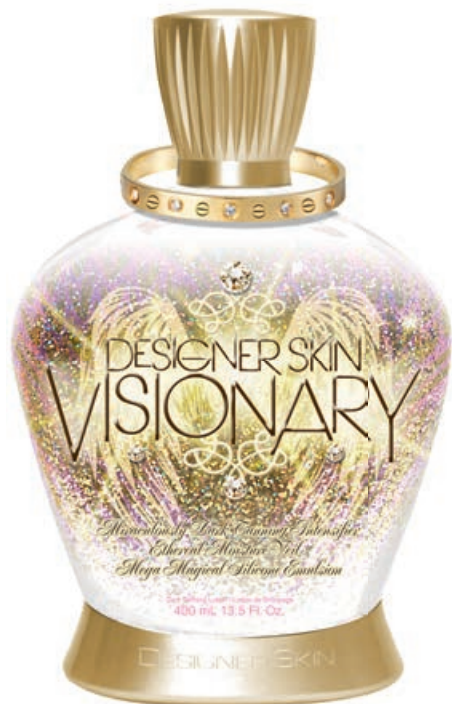
Visionary™ • 400 мл / 15 млл Ускоритель загара.

Мощный активатор загара с комплексом, улучшающим текстуру кожи.