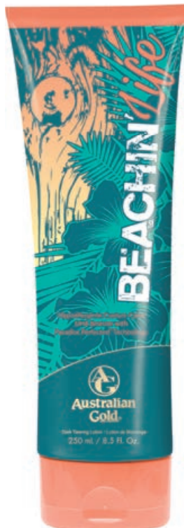
Beachin' Life™ • 250 мл / 15 мл Стойкий, проявляющийся загар.

Гипоаллергенный крем-активатор с комбинированным, растительным бронзирующим комплексом.