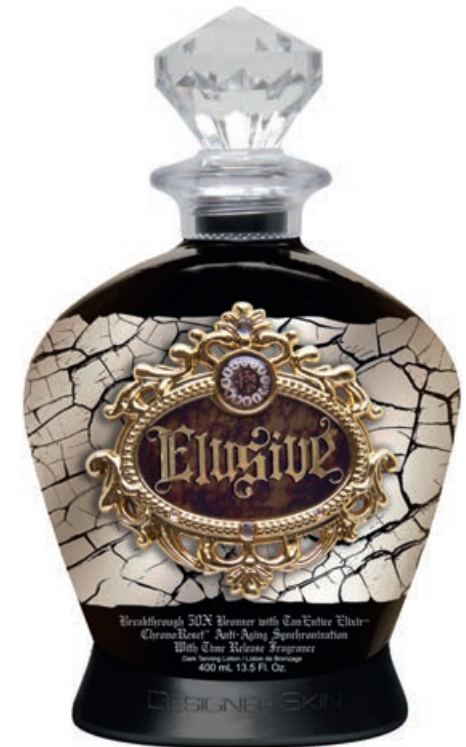
Elusive™ • 400 мл / 15 мл Стойкий, проявляющийся загар.

50X крем-бронзатор для загара, с особым питательным комплексом и антивозрастной формулой.