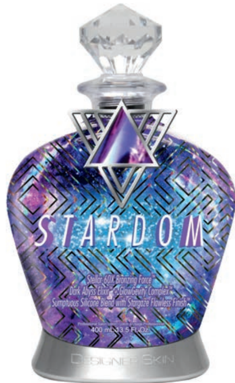
Stardom™ • 400 мл / 15 мл Стойкий, проявляющийся загар.

60X лосьон для загара с эффектом выравнивания кожи и стойким бронзирующим комплексом.