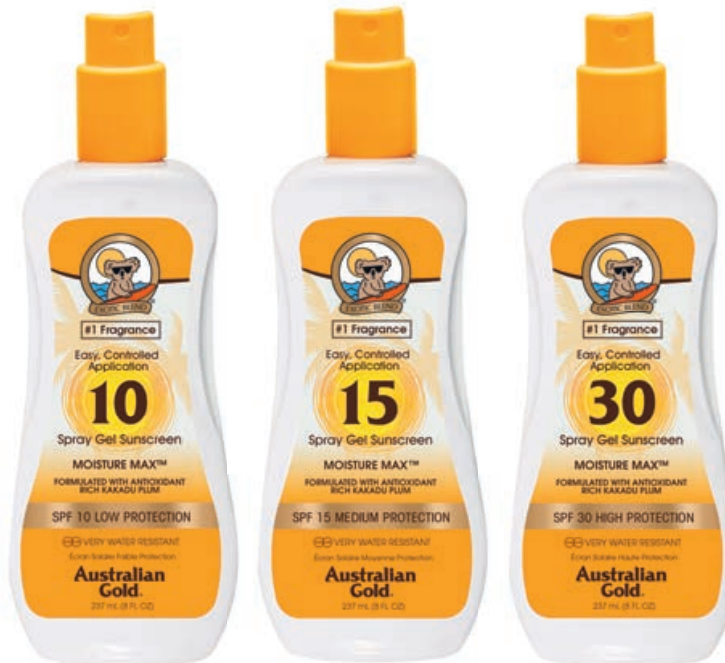
Защитные спрей-гели 10, 15, 30 • 237 мл

Влагоустойчивый солнцезащитный лосьон с высоким фактором защиты и гипоаллергенной формулой. Создан специально для детской кожи. Эффективен даже при купании. В составе экстракт Алоэ вера, масла Оливы, Чайного дерева и семян Подсолнечника, Пантенол, витамин E.