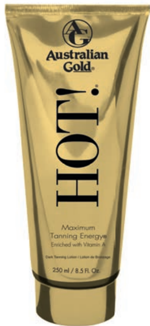
Hot!® • 250 мл / 15 мл Ускоритель загара.

Витаминный комплекс для загара, активирующий выработку собственного меланина.