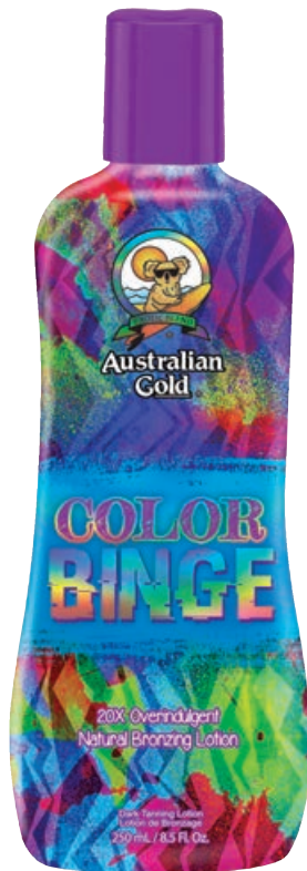
Color Binge™ • 250 мл / 15 мл Коррекция оттенка загара.

Экстремально увлажняющий крем-бронзатор мгновенного действия.