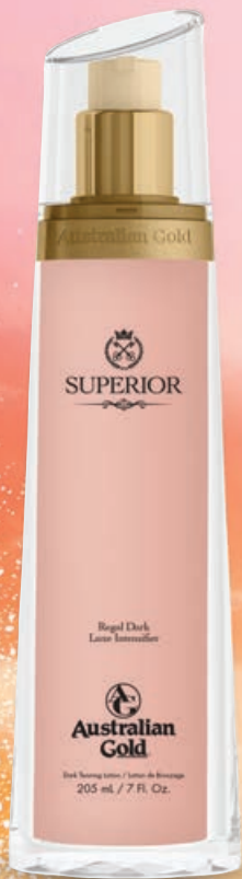
Superior™ Intensifier • 205 мл / 28.5 мл Ускоритель загара.

Высокотехнологичная сыворотка-активатор класса «Люкс».