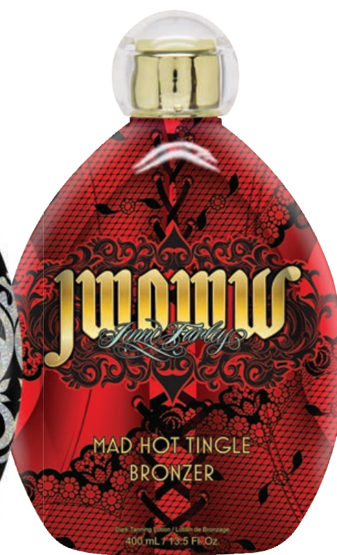
JWOWW Mad Hot Tingle Bronzer • 400 мл / 15 мл