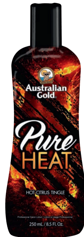
Pure Heat™ • 250 мл / 15 мл Активная стимуляция выработки собственного меланина.