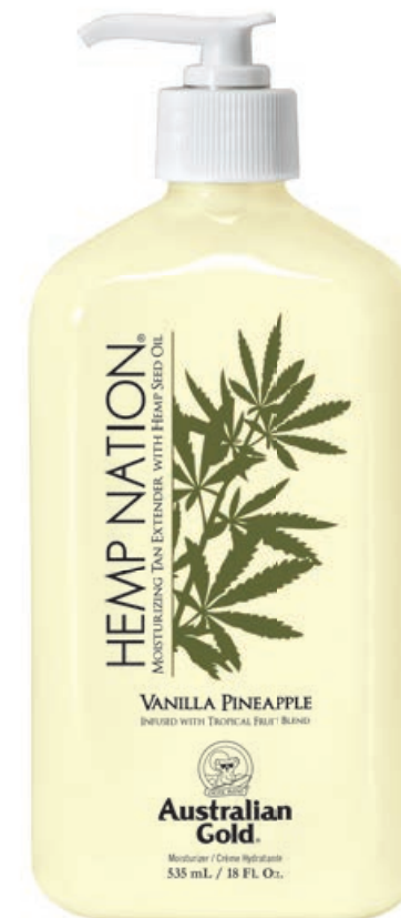
Hemp Nation® Vanilla Pineapple • 535 мл

Профессиональный увлажняющий лосьон для ежедневного применения на основе масла семян конопли.