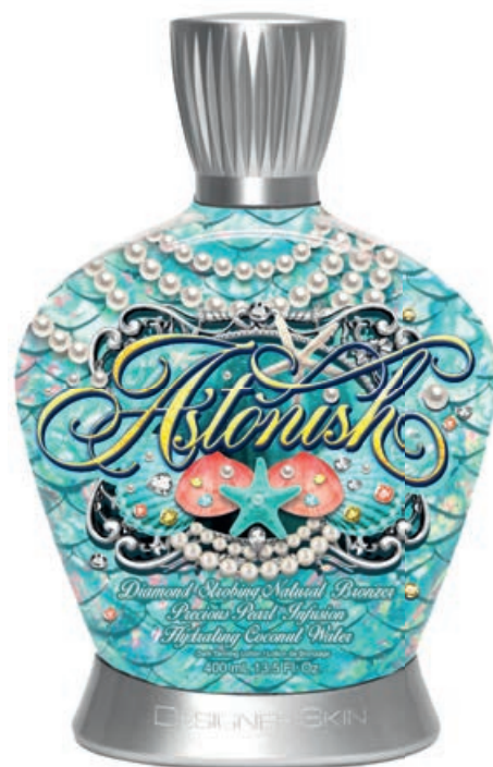
Astonish™ • 400 мл / 15 млл Коррекция оттенка загара.

Лосьон-активатор преображающий кожу с мгновенным бронзирующим комплексом.