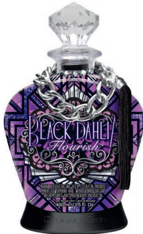
Black Dahlia Flourish™ • 400 мл / 15 мл Стойкий, проявляющийся загар.

45X роскошная эмульсия класса «Люкс» для достижения ультра-темного загара.