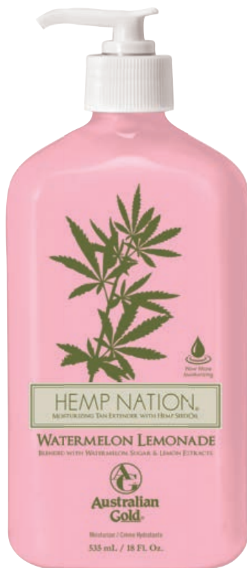
Hemp Nation® Watermelon Lemonade • 535 мл

Профессиональный питательный лосьон для ежедневного применения на основе масла семян конопли.