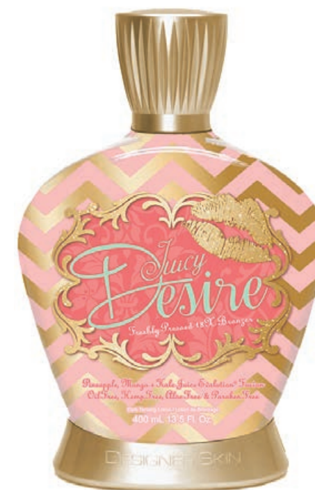
Juicy Desire™ • 400 мл / 15 млл Стойкий, проявляющийся загар.

18X Витаминизированный коктейль для получения стойкого непревзойденного загара.