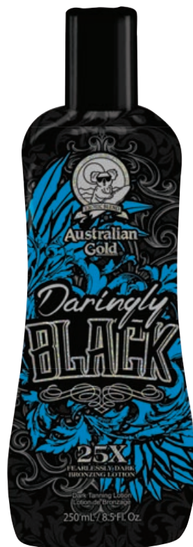
Daringly Black™ • 250 мл / 15 мл Стойкий, проявляющийся загар.

Крем-бронзатор с формулой повышенной стойкости.