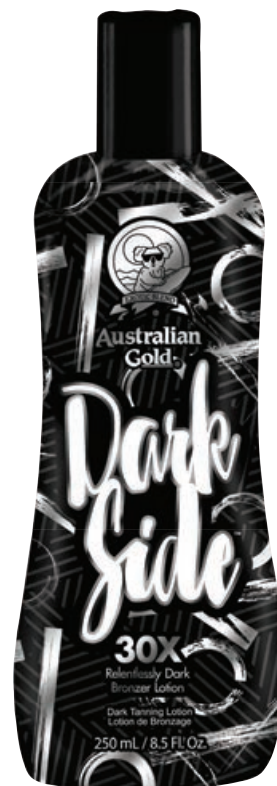
Dark Side™ • 250 мл / 15 мл Стойкий, проявляющийся загар.

Питательный крем-бронзатор с эффектом комплексного бронзирования.