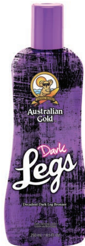
Dark Legs® • 250 мл / 15 мл Стойкий, проявляющийся загар.

Тонизирующий, питательный крем для загара (усиление загара ног).