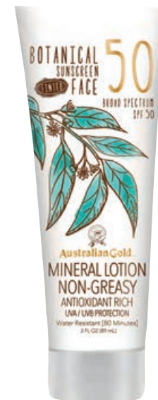
Botanical Tinted Face SPF 50 • 88мл

Минеральные солнцезащитные фильтры обеспечивают эффективную защиту от воздействия лучей (UVA/UVB). Экстракты Австралийских растений (слива Какаду, Красные водоросли и Эвкалипт), насыщенные витаминами и антиоксидантами, защищают кожу от воздействия свободных радикалов и преждевременного фотостарения. Сбалансированная формула не оставляет белых следов, оставляя матовый финиш, без жирного блеска и липкости. Масло Ши и Пантенол активно восстанавливают и успокаивают раздраженную кожу, Сквалан повышает ее эластичность и ускоряет регенерацию.