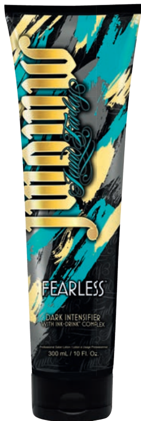
JWOWW Fearless™ • 300 мл / 15 мл