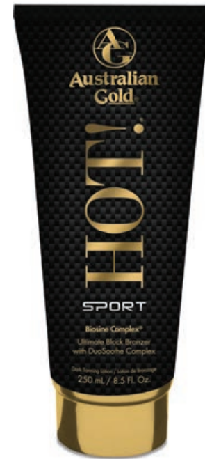
Hot!® Sport • 250 мл / 15 мл Стойкий, проявляющийся загар.

Витаминный комплекс для загара, активирующий выработку собственного меланина и особой бронзирующей технологией.