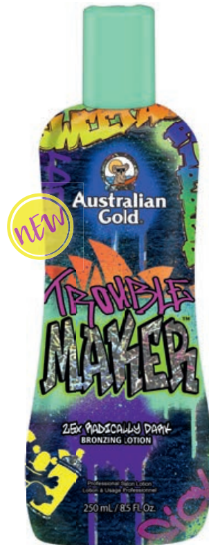
Trouble Maker™ • 250 мл / 15 мл Стойкий, проявляющийся загар.

Увлажняющий лосьон для загара с эффектом комплексного бронзирования.