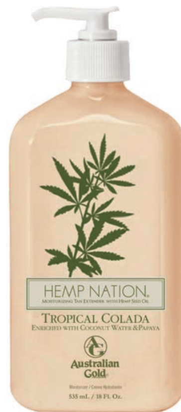
Hemp Nation® Tropical Colada • 535 мл

Профессиональный питательный лосьон для ежедневного применения на основе масла семян конопли.