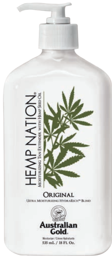
Hemp Nation® Original • 535 мл

Профессиональный увлажняющий лосьон для ежедневного применения на основе масла семян конопли.