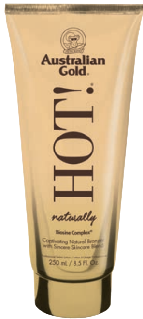
Hot!® Naturally • 250 мл / 15 мл Коррекция оттенка загара.

Витаминный комплекс для загара, активирующий выработку собственного меланина с ярко выраженной коррекцией оттенка загара.