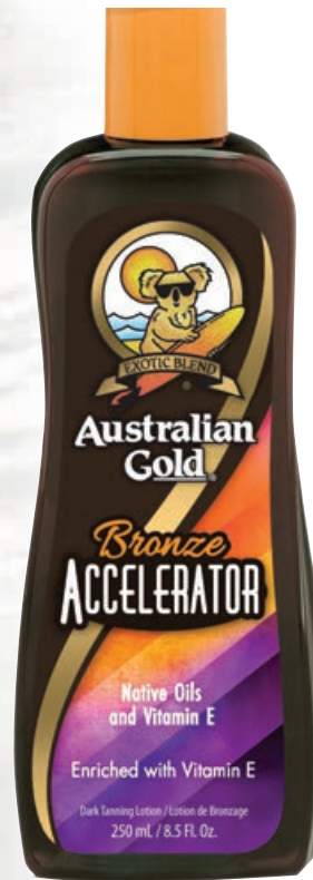
Bronze Accelerator™ • 250 мл / 15 мл Коррекция оттенка загара.

Лосьон-активатор выработки собственного меланина с эффектом бронзирования.