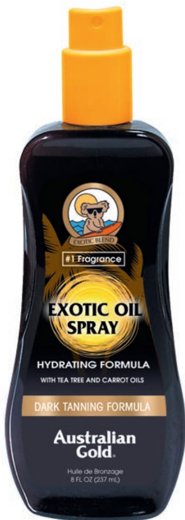
Exotic Oil Spray • 237 мл