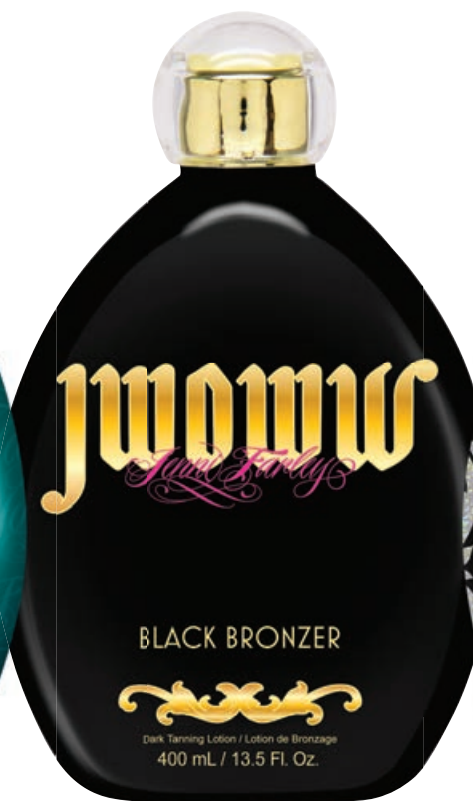
JWOWW Black Bronzer • 400 мл / 15 мл