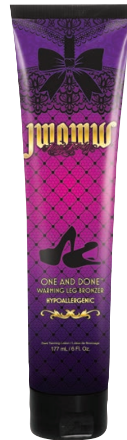
JWOWW One and Done™ Warming Leg Bronzer • 177 мл / 15 мл