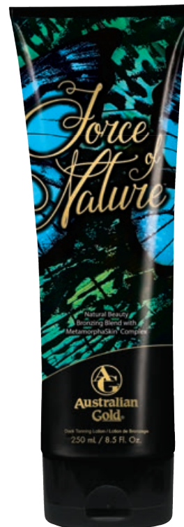
Force of Nature™ • 250 мл / 15 мл Коррекция оттенка загара.

Активный ускоритель загара с мгновенным бронзирующим комплексом и защитой тату/перманентного макияжа.