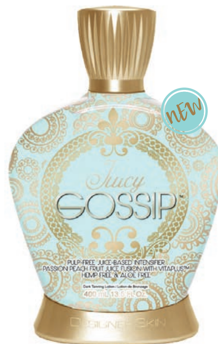
Juicy Gossip™ • 400 мл / 15 млл Ускоритель загара.

Витаминизированный коктейль, активирующий выработку собственного меланина.