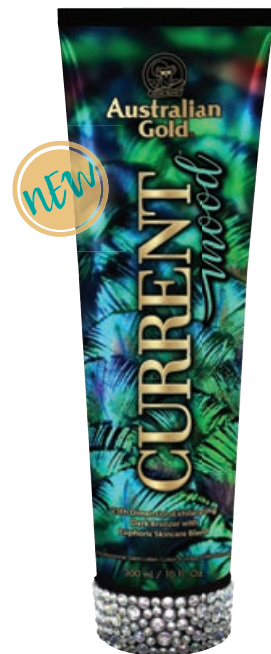
Current Mood™ • 300 мл / 15 мл Стойкий, проявляющийся загар.

Активный ускоритель загара премиум класса, с темным бронзирующим и смягчающим комплексами.