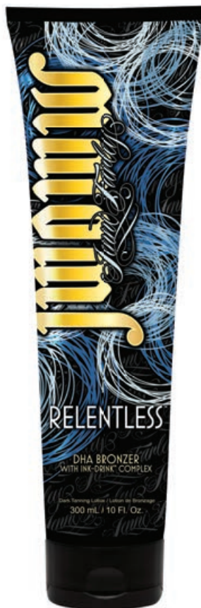
JWOWW Relentless™ • 300 мл / 15 мл