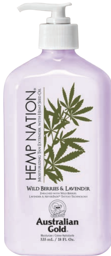
Hemp Nation® Wild Berries & Lavender • 535 мл

Профессиональный увлажняющий лосьон для ежедневного применения на основе масла семян конопли с технологией защиты тату/перманентного макияжа.