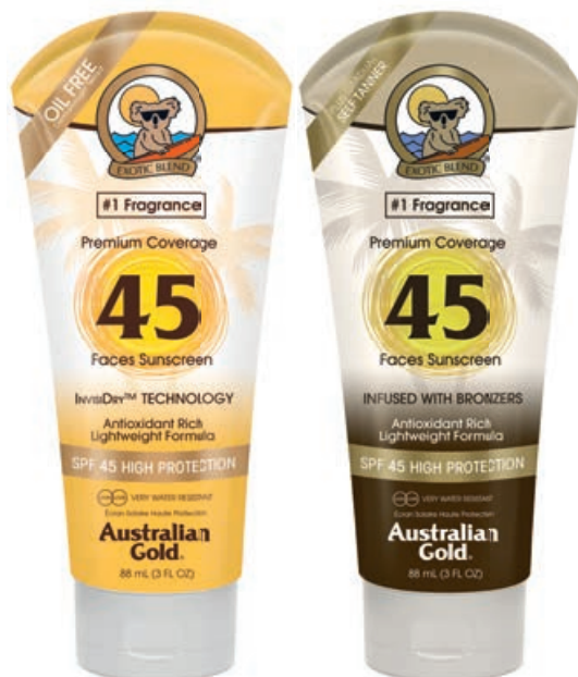
Premium Coverage 45 Faces • 88 мл

Влагоустойчивые спрей-гели для загара обладают широким спектром защиты UVA/UVB, не позволят коже обгореть и защитят ее от солнечных ожогов. Витамин E, Алоэ Вера и экзотические масла увлажняют и восстанавливают кожу во время загара. Технология Fresh Feel обеспечивает быструю впитываемость без лишнего блеска и липкости.