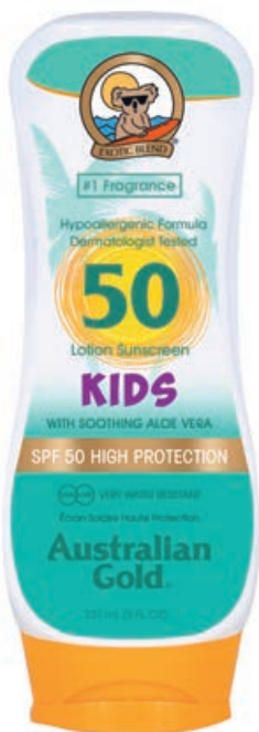
Защитный лосьон SPF 50 Kids • 237 мл

Влагоустойчивый солнцезащитный лосьон с высоким фактором защиты и гипоаллергенной формулой. Создан специально для детской кожи. Эффективен даже при купании. В составе экстракт Алоэ вера, масла Оливы, Чайного дерева и семян Подсолнечника, Пантенол, витамин E.