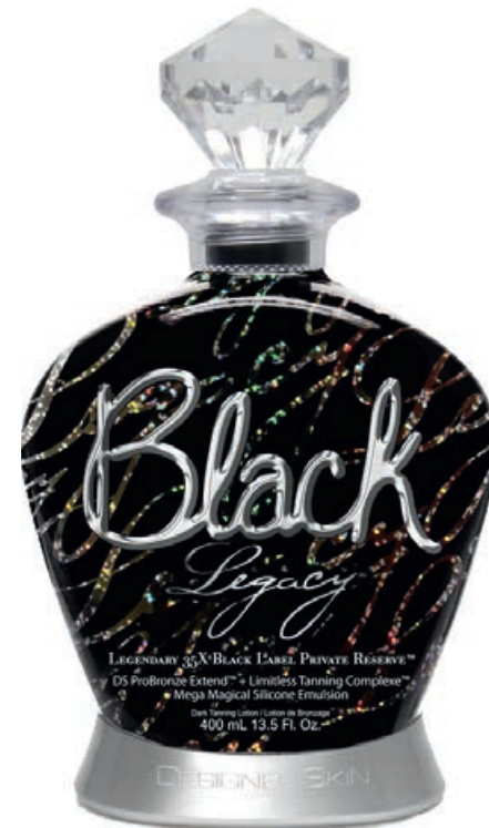
Black Legacy™ • 400 мл / 15 мл Стойкий, проявляющийся загар.

35X эмульсия для активации темнейшего загара с уникальной технологией смягчения кожи.