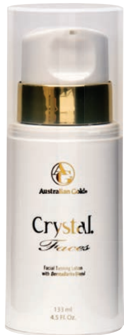
Crystal® Faces • 133 мл / 28.5 мл Ускоритель загара.

Крем-активатор класса «Люкс» для лица, стимулирующий выработку коллагена.